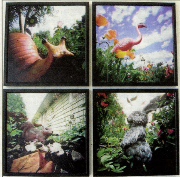
Sur le thème de la nature urbaine, vingt-cinq photographes européens et américains exposent leurs œuvres prises au sténopé, un procédé de chambre noire parfois artisanal (à gauche).